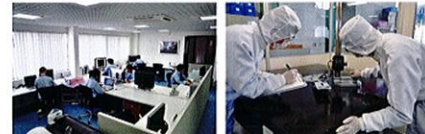
研究開発、新製品開発を続ける中で全ての社員が技術向上を目指し、昇給や昇進などのチャンスが与えられている。